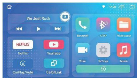
(interface système Android carplay box)

il est normal que l'écran de la voiture redémarre lors de la première connexion avec carplay box, il est nécessaire de faire correspondre l'écran et la résolution